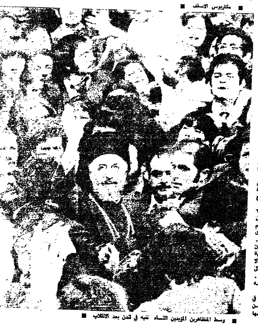
وسط المظاهرات المؤبدن التفاء نفيه في لندن بعد الانقلاب